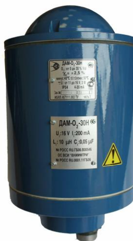
Рисунок 1. Внешний вид газоанализаторов ИБЯЛ.407111.002,-01 с диффузионным способом отбора пробы

Схема пломбировки от несанкционированного доступа и обозначение мест для нанесения оттисков клейм приведена на рисунке 4.