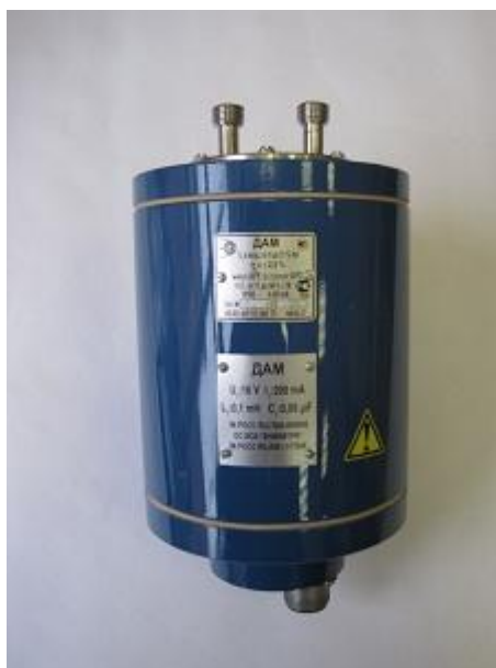
Рисунок 2. Внешний вид газоанализаторов с принудительным способом отбора пробы исполнения ИБЯЛ.407111.002-02...-49